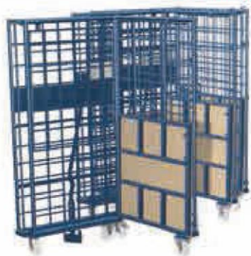
Corletta Sejf w stanie złożonym

Corletty® Sejf bez towaru mogą być wsuwane jedna w drugą dzięki „trikowi ze składaniem”. W ten sposób oszczędzamy miejsce na ich składowanie.