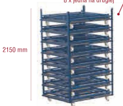
Corletta® Quadro 8 x jedna na drugiej

Corletty® Quadro mogą być ładowane na samochód ciężarowy po 8 jedna nad drugą i 2 sztuki obok siebie. Na zaledwie jednym metrze bieżącym powierzchni ładunkowej zmieści się zatem 16 sztuk. Na tej samej powierzchni można ustawić 4 sztuki Corlett® z ładunkiem.